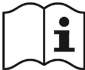
Рисунок 3 - Пиктограмма