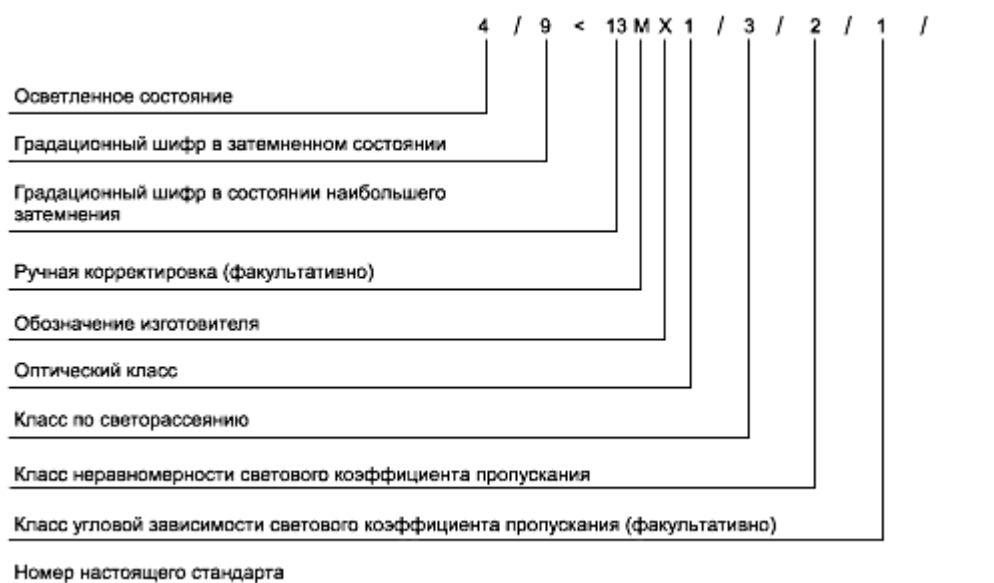
Схема полной маркировки:

Б.10.3.4 Там, где это применимо, должны быть добавлены буквенные обозначения соответствия частным требованиям: специальным и дополнительным по [3].